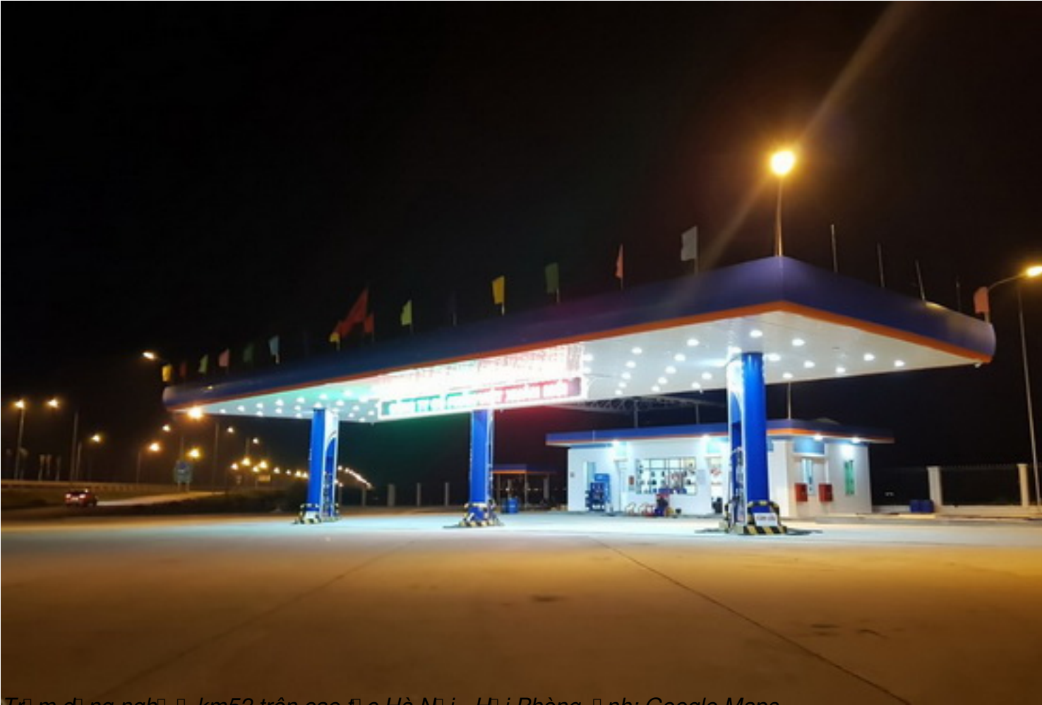
Trạm dừng nghỉ 1 km52 trên cao tốc Hà Nội – Hải Phòng