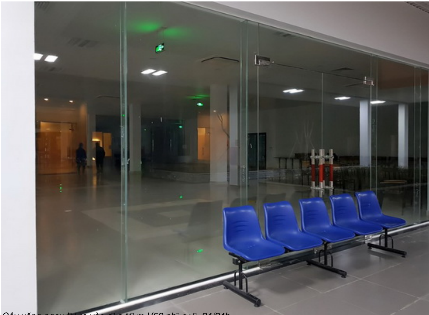
Cây xăng ngay phía ra vào cửa trạm V52 phục vụ 24/24h.