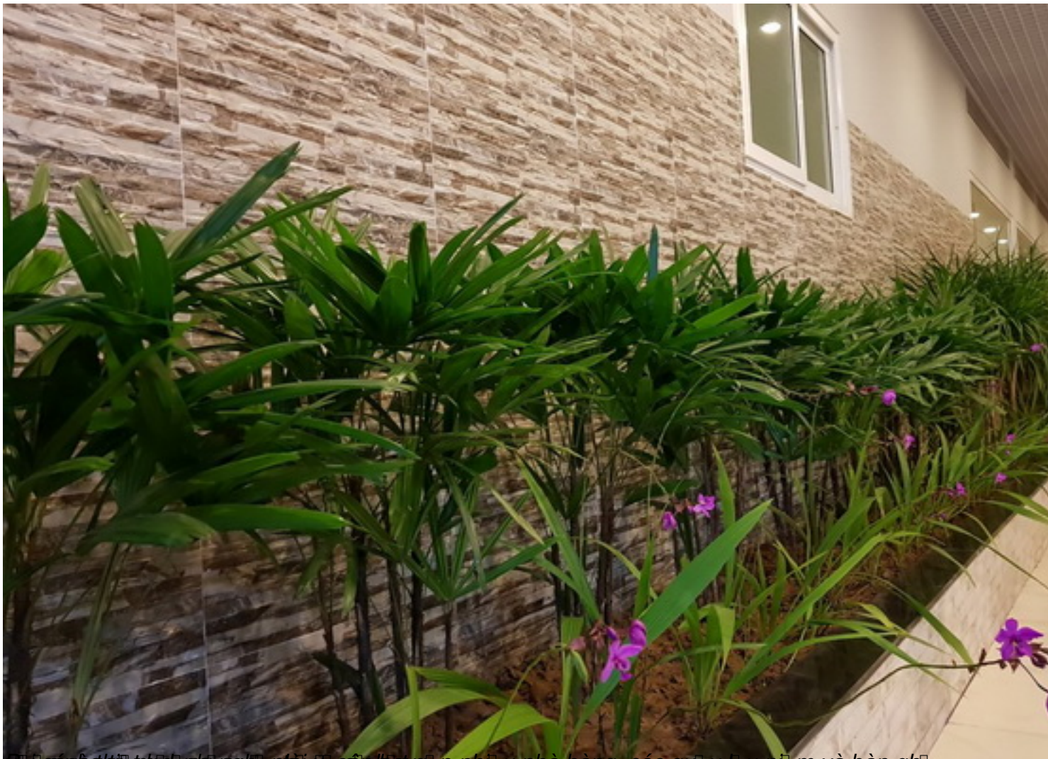
... các nhà thiết kế, người nghệ sĩ và các nhà sản xuất, những người ưu tiên nhà hàng, các quy trình và nhân viên và bàn ghế ...