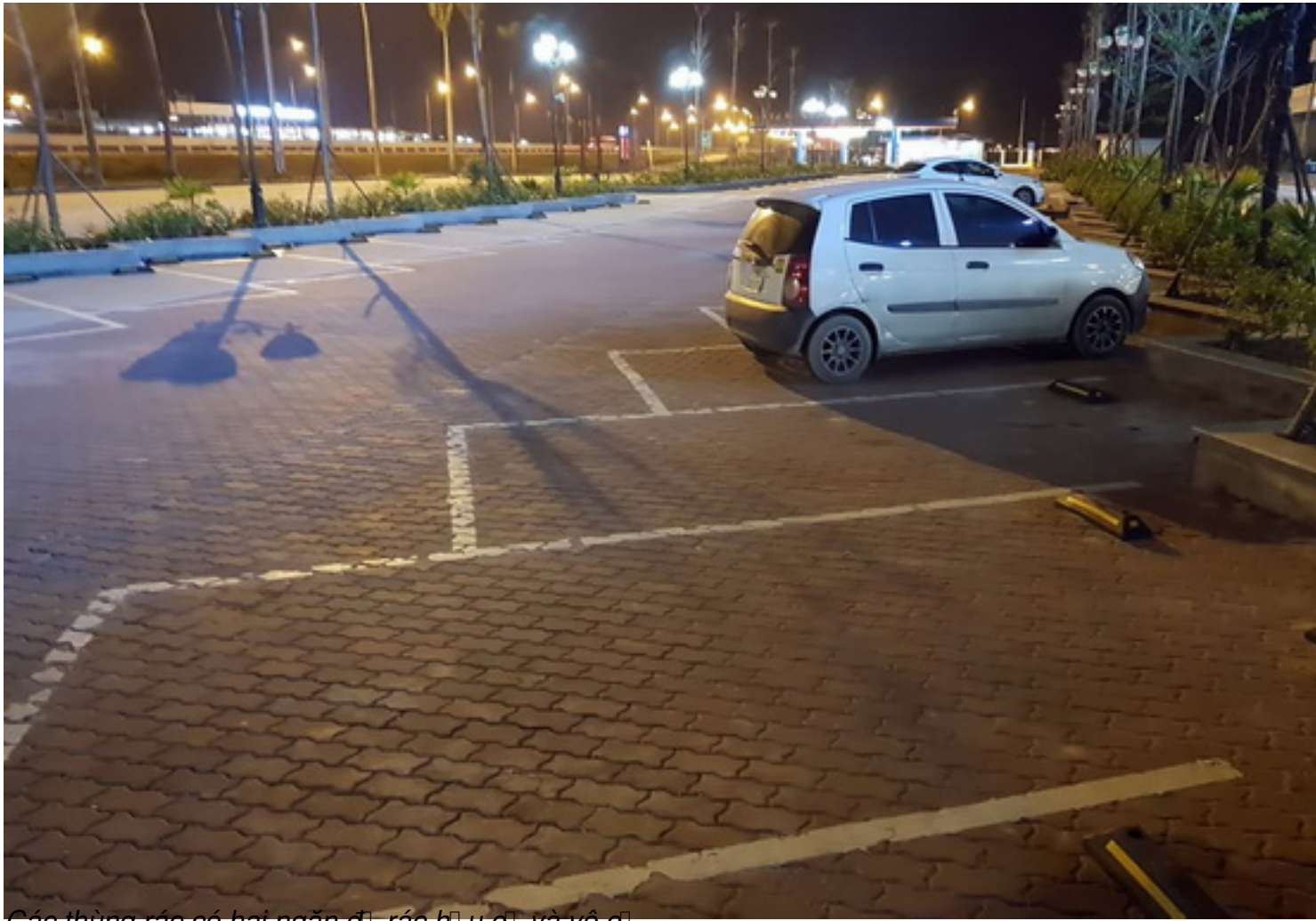
Các thùng rác có hai ngăn để rác hữu cơ và vô cơ.