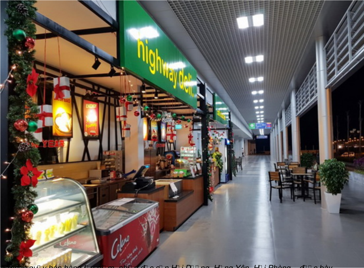
Ảnh các quầy bán hàng lưu niệm, nhũ u đồ c s n H i D ã ng, H ã ng Yên, H i Ph ò ng... đ ã c bày