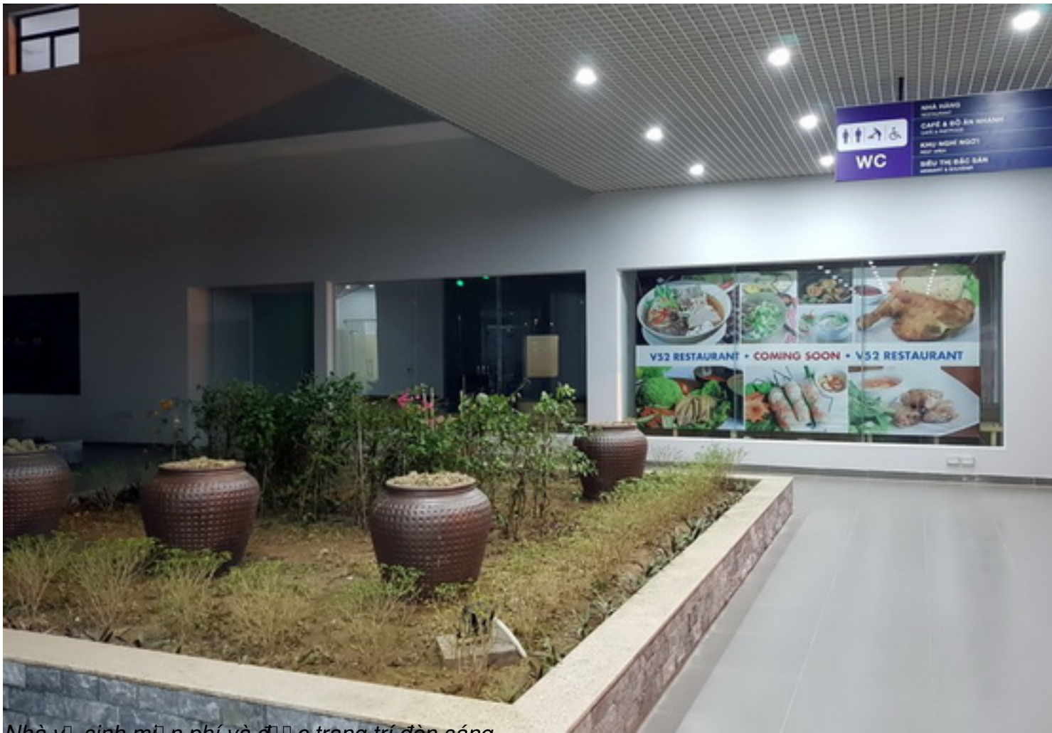
Nhà vườn sinh miễn phí và decor trang trí đèn sáng.