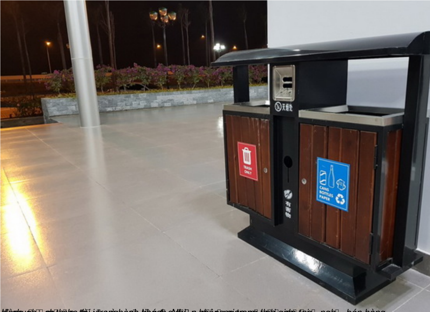
Thiết kế, chế tạo và lắp đặt hệ thống rác công nghệ cao tầng không gian công nghệ, bán hàng