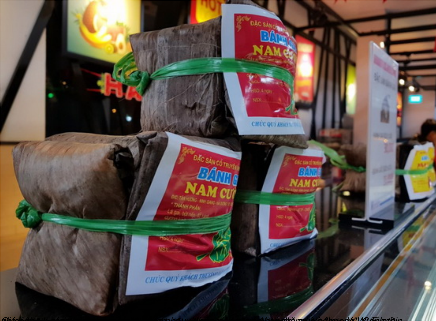
Đĩa bánh gai các thương hiệu cùng nhau và các nhà sản xuất gia đình phở và "hộp" Wafle hiện