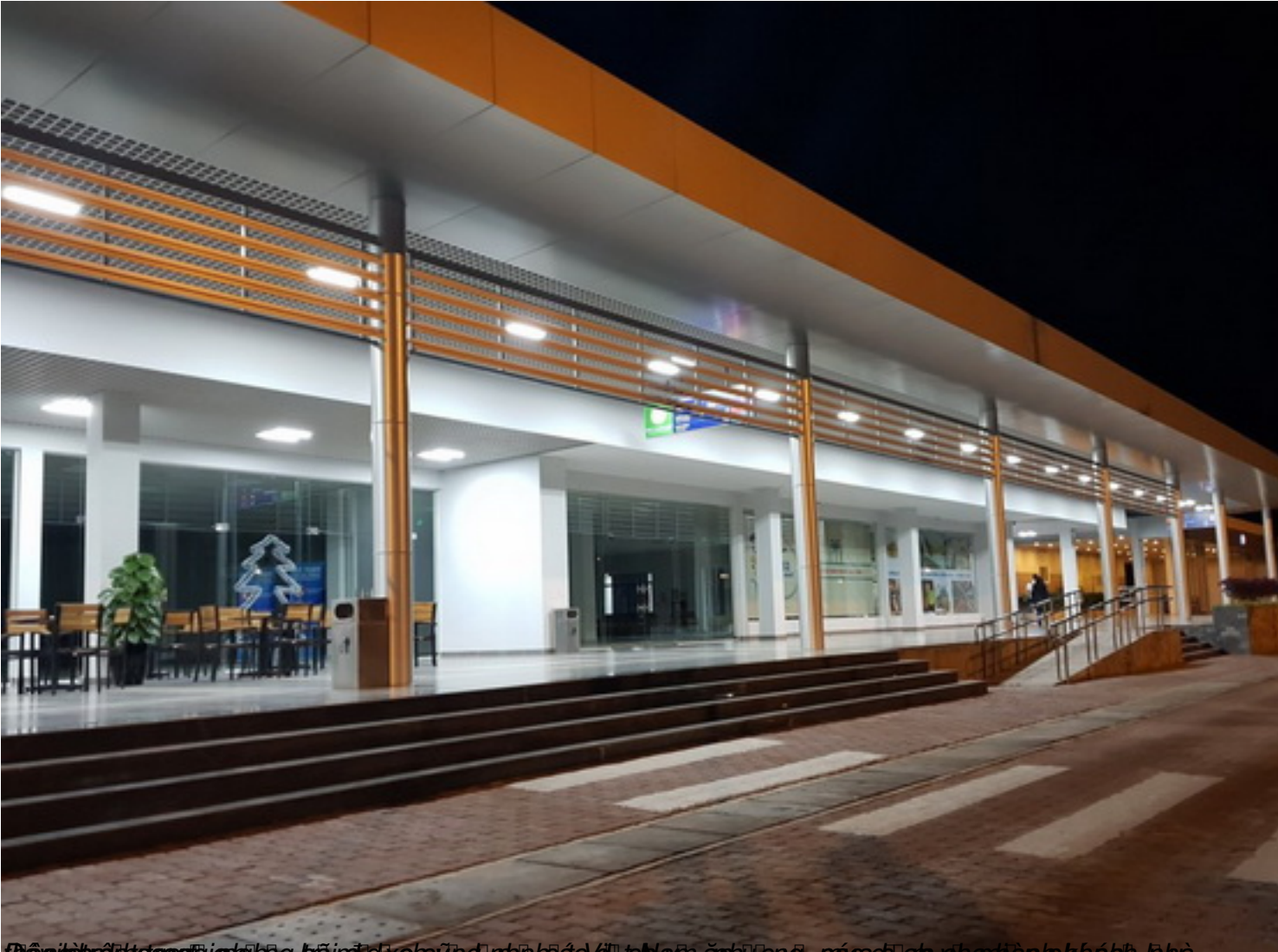
Đây là một trong những công trình xây dựng nhà ở xã hội tại Hà Nội, phục vụ các công nhân viên chức và người lao động.