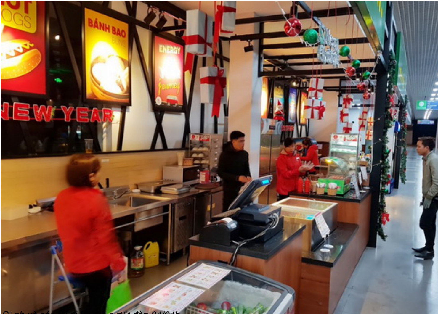
Sinh và các dịch vụ khác có sẵn 24/24h.