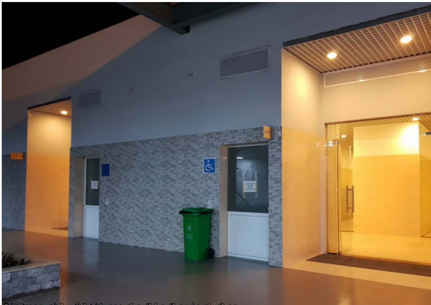
Bên trong, nhìn từ sảnh cao cấp đi vào sảnh.