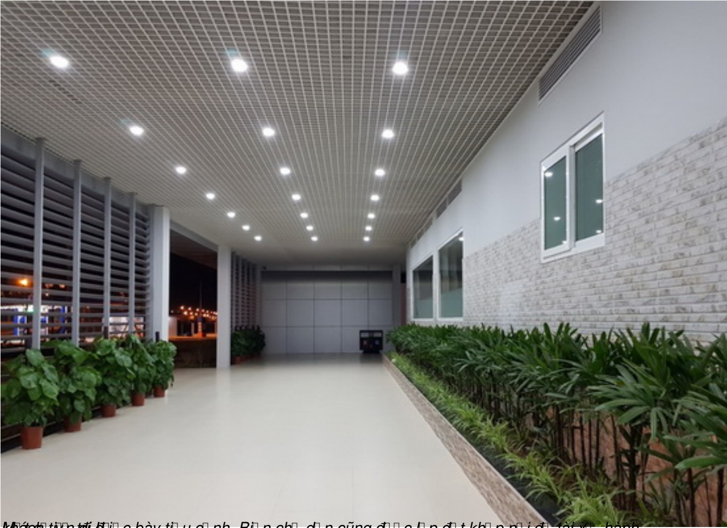
Mặt sàn tối ưu cho bày trí uôn nh. Bên chôn dôn cũng đôn côn pôn tôn khôn pôn iôn tài xôn, hành