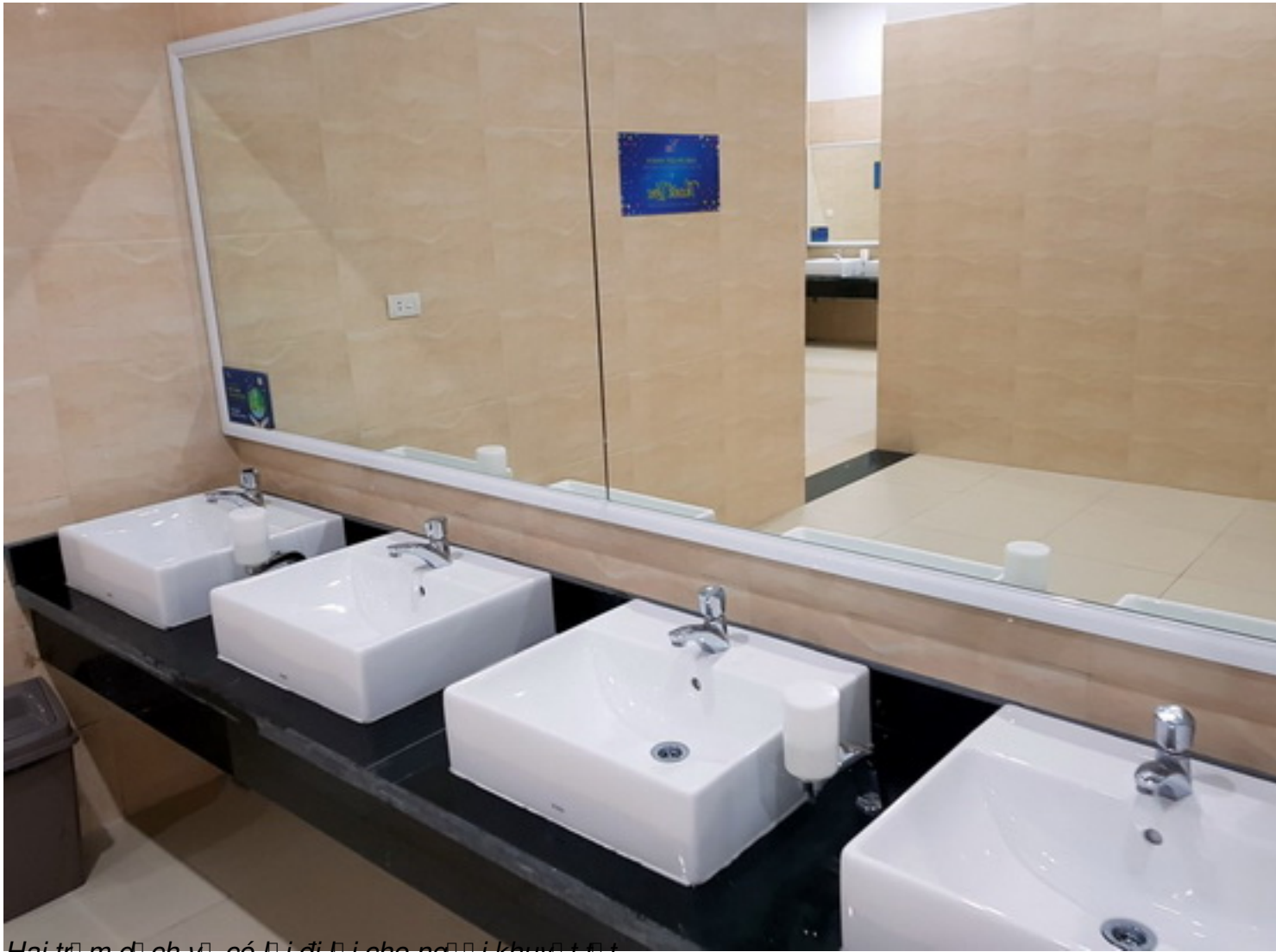
Hai trạm dịch vụ có đi để cho người khuyết tật.